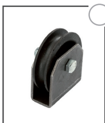
Seilrolle, mit Anschweißbock