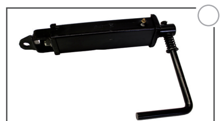
Standbremse mit Wendegriff