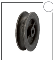
Seilrolle, lose - grundiert